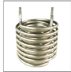
Échangeur en titane