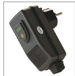
PLUG & PLAY 220 V