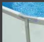
Tubes métal en demi lune robustes