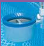
Skimmer de surface