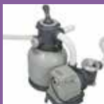
Filtre à sable 6 m 3 /h