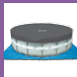
Bâche et tapis de sol