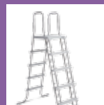
Echelle de sécurité avec marches amo- vibles