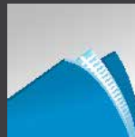
Liner triple épais- seur