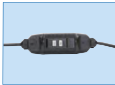
Prise électrique avec protection différentielle 10 mA