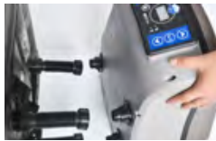
Bloc moteur amovible