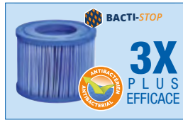
1 cartouche de filtration Bacti-Stop incluse